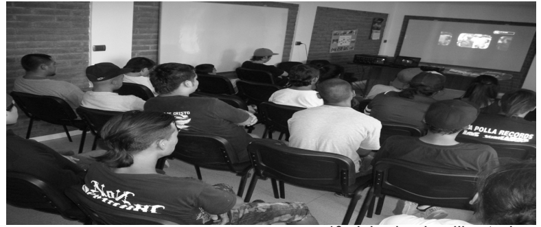
1º ciclo de cine libertario

liricas con una crítica social, lo cual origina que muchos/as jóvenes se fueran cuestionando del actual sistema de que eran parte. Al mismo tiempo este colectivo junto a otras individualidades dio paso a que se levantara un "Centro Cultural Autónomo La PATÁ", (lo más cómico fue que se utilizó una antigua sede que pertenecía a "CEMA Chile") que si bien no era exclusivamente anarquista, si tuvo participación de ciertas individualidades afin con la idea, de las cuales surgieron, este espacio sirvió para poder reunir, reorganizar y conocer a compañeros/as de distintos sectores, lo que también permitió que se realizarán diversas actividades en torno con el arte y la cultura, de esta manera se generó la instancia para empezar a distribuir prensa anarquista (por el momento no existe alguna información si existía en alguna oportunidad presencia anarquista en estas tierras, que de todas maneras sería muy importante conocer) como el Periódico Agitación de aquellos tiempos y el Surco. Sin embargo surgieron distintas críticas entorno a lo que se realizaba en "La PATÁ" y a la forma de organización que tuvo, pero si estamos claro que fue una